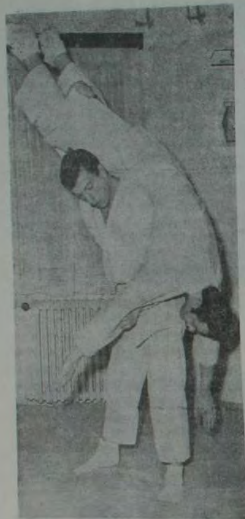
Moment din însușirea procedurilor de autoapărare

colonel, vin direct din facultăți, unde există mult mai multă libertate decât într-o școală militară. Aveți greutăți cu starea disciplinară? Cu însușirea problemelor de specialitate?