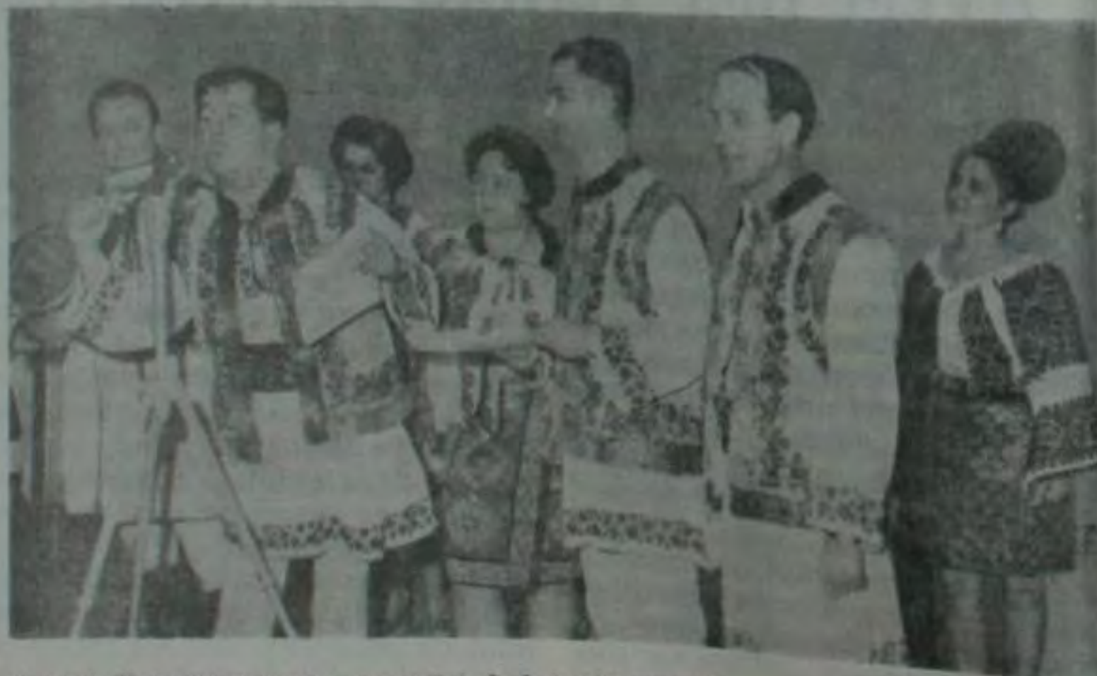
Aspect dintr-un program prezentat de brigada artistică a Inspectoratului de securitate al județului Suceava

În cadrul unității, s-a organizat un cineclub condus de adjunctul inspec-