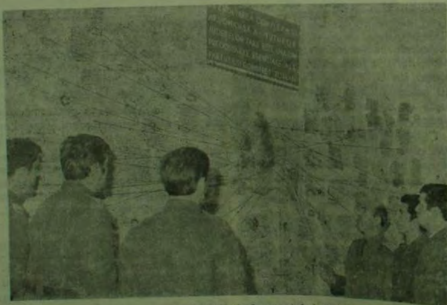
Consultație la punctul de informare și documentare