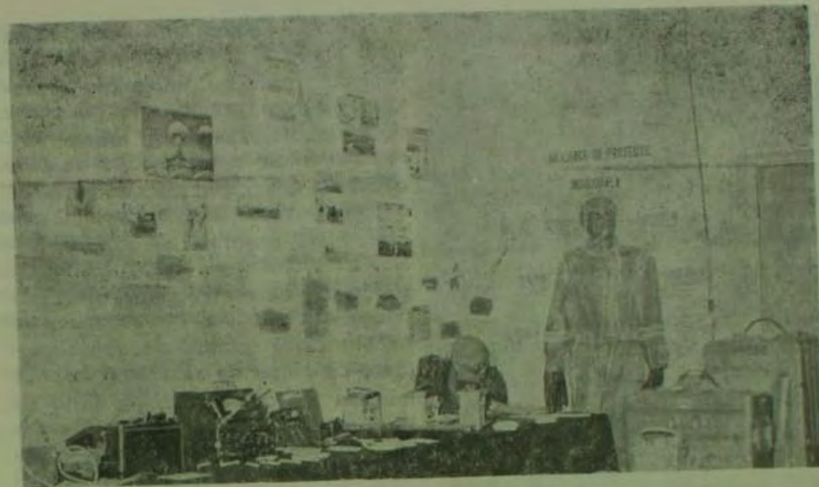
Aspect din sala tehnică a școlii

— Da, s-ar putea să nu fie exagerat. În orice caz, manifestă toți o curiozitate deosebită pentru problemele politice. Este firesc, deoarece munca noastră e, în esența ei, o activitate politică. Pun cele mai neașteptate întrebări, nu numai la pregătirea